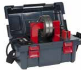
Mobiler Betex-Induktionsanwärmer BETEX BLF 200