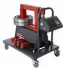
38 ZFD Kap. 300 kg

BETEX® ist eine eingetragene Marke von Bega Special Tools