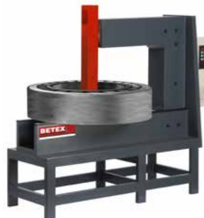
GIANT Kap. 3500 kg