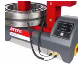
Duale Temperaturabtastung (Überwachung von ΔT)