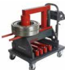
40 RSD Kap. 350 kg