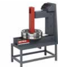
SUPER Kap. 600 kg