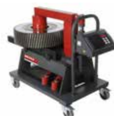
40 RMD Kap. 600 kg